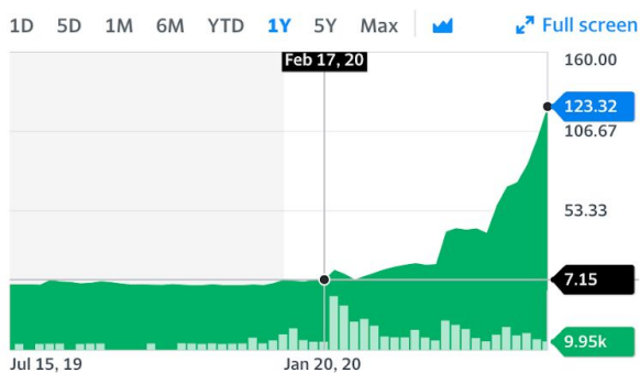
Chart Events ⓘ Neutral pattern detected View all chart patterns